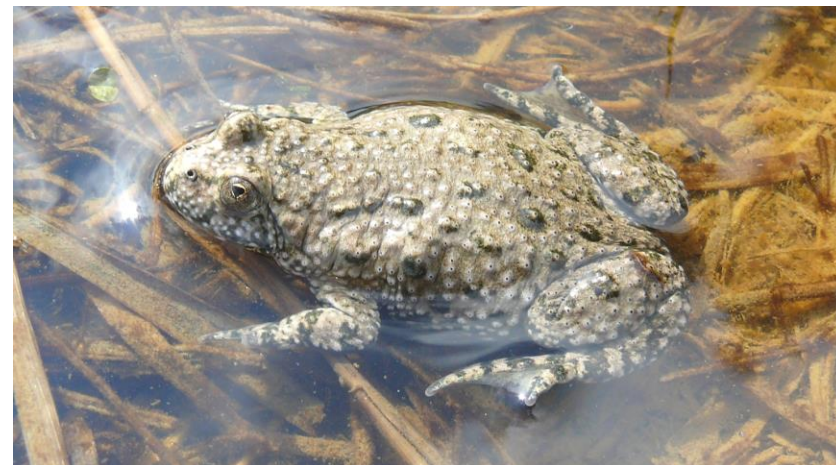
Kuňka ohnivá – nejohroženější druh obojživelníka, který se zde vyskytuje. Zejména na její podporu jsou managementová opatření prováděna.