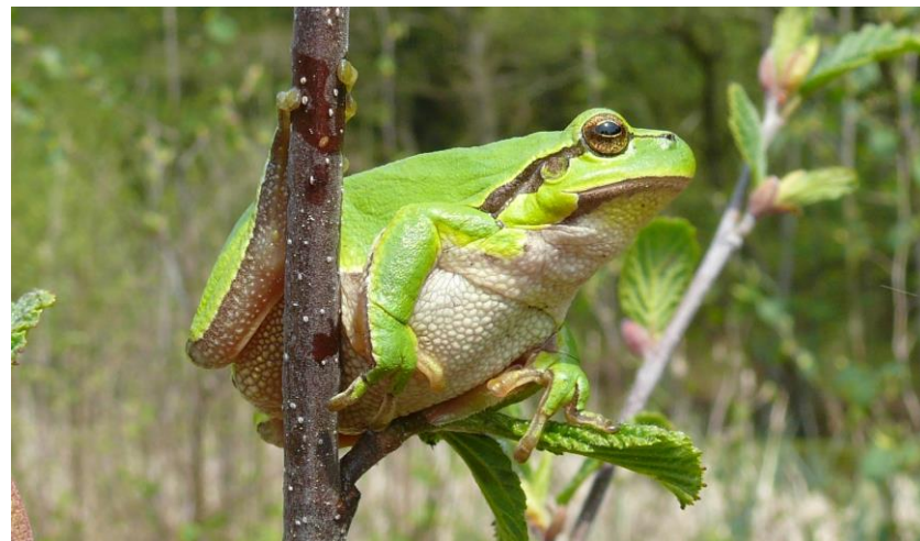
Rosnička zelená – jeden z druhů obojživelníků, na jehož podporu jsou managementová opatření prováděna.