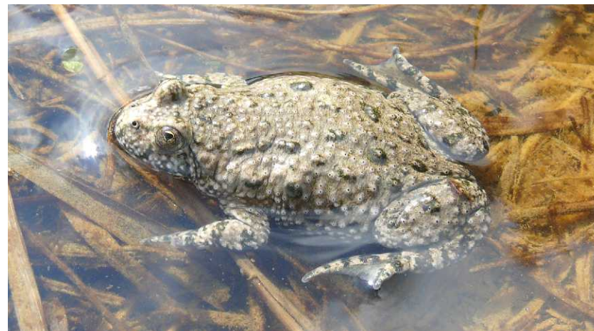
Kuňka obecná – nejohroženější druh obojživelníka, který se zde vyskytuje. Zejména na její podporu jsou managementová opatření prováděna.

Ministerstvo životního prostředí České republiky