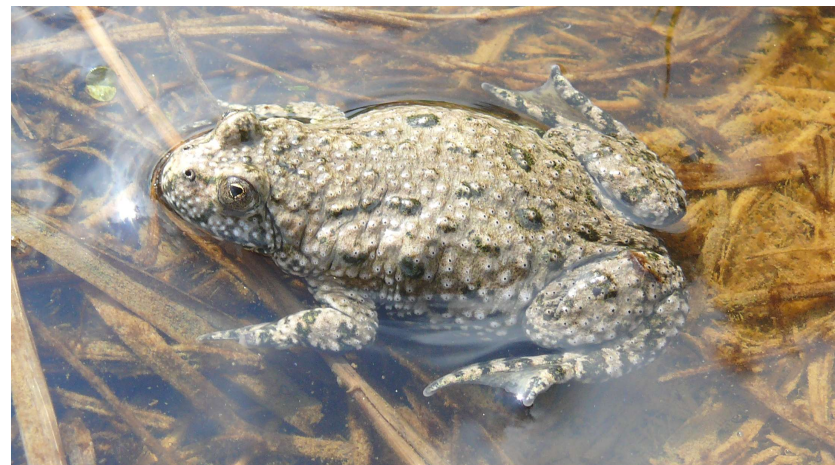
Kuňka ohnivá – nejohroženější druh obojživelníka, který se zde vyskytuje. Zejména na její podporu jsou managementová opatření prováděna.

Ministerstvo životního prostředí České republiky