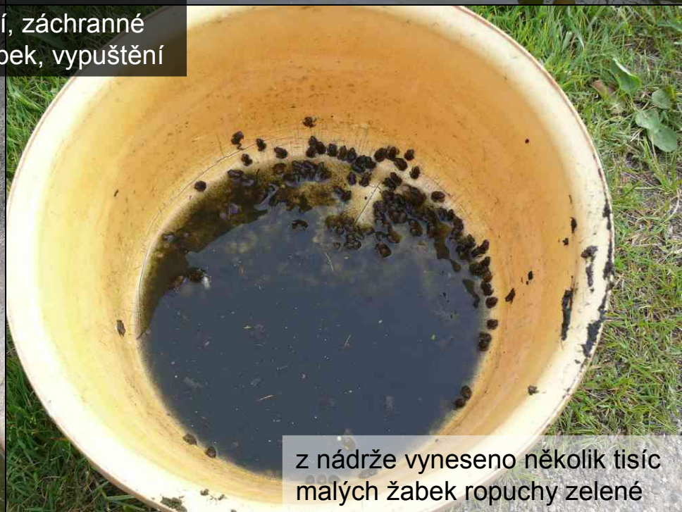
z nádrže vyneseno několik tisíc malých žabek ropuchy zelené