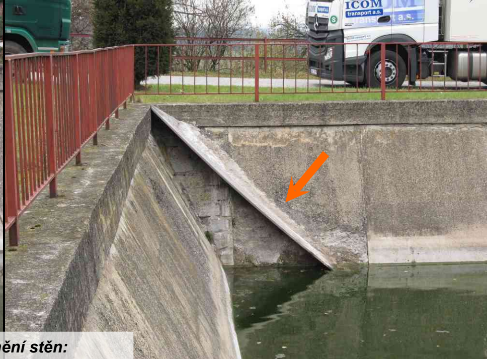
Zprůchodnění stěny: detail rampy a úpravy fošny...