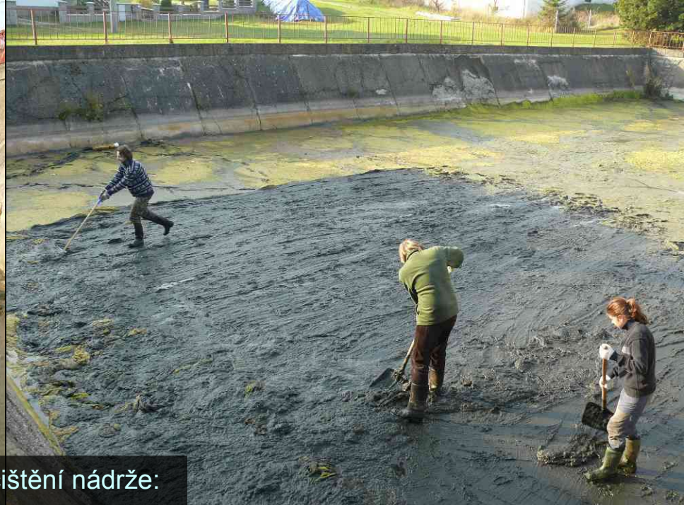
První fáze čištění nádrže: podzim 2011 - ponechání hmoty v rozích