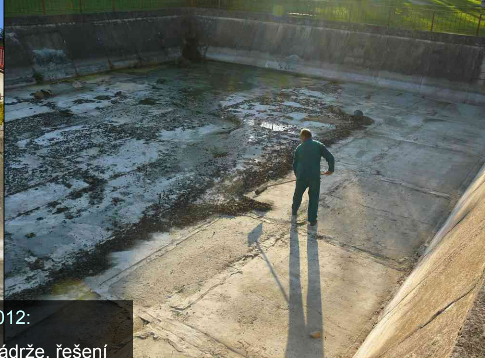
2012: dočištění nádrže, řešení průchodnosti stěn – betonování rampy a fošny