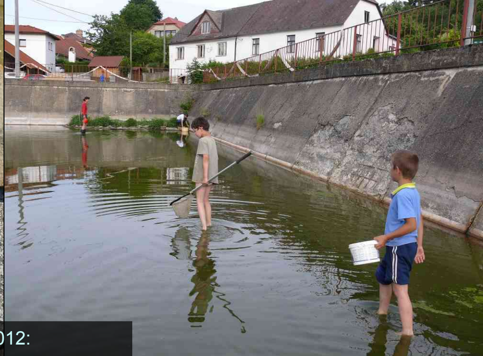
2012: napouštění, záchranné transfery žabek, vypuštění