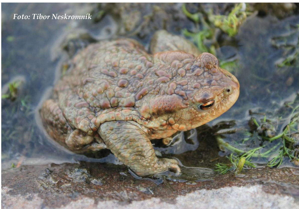
Foto 8: Ropucha obecná je na zábranách u Svitáku dominantným druhem (duben 2015)