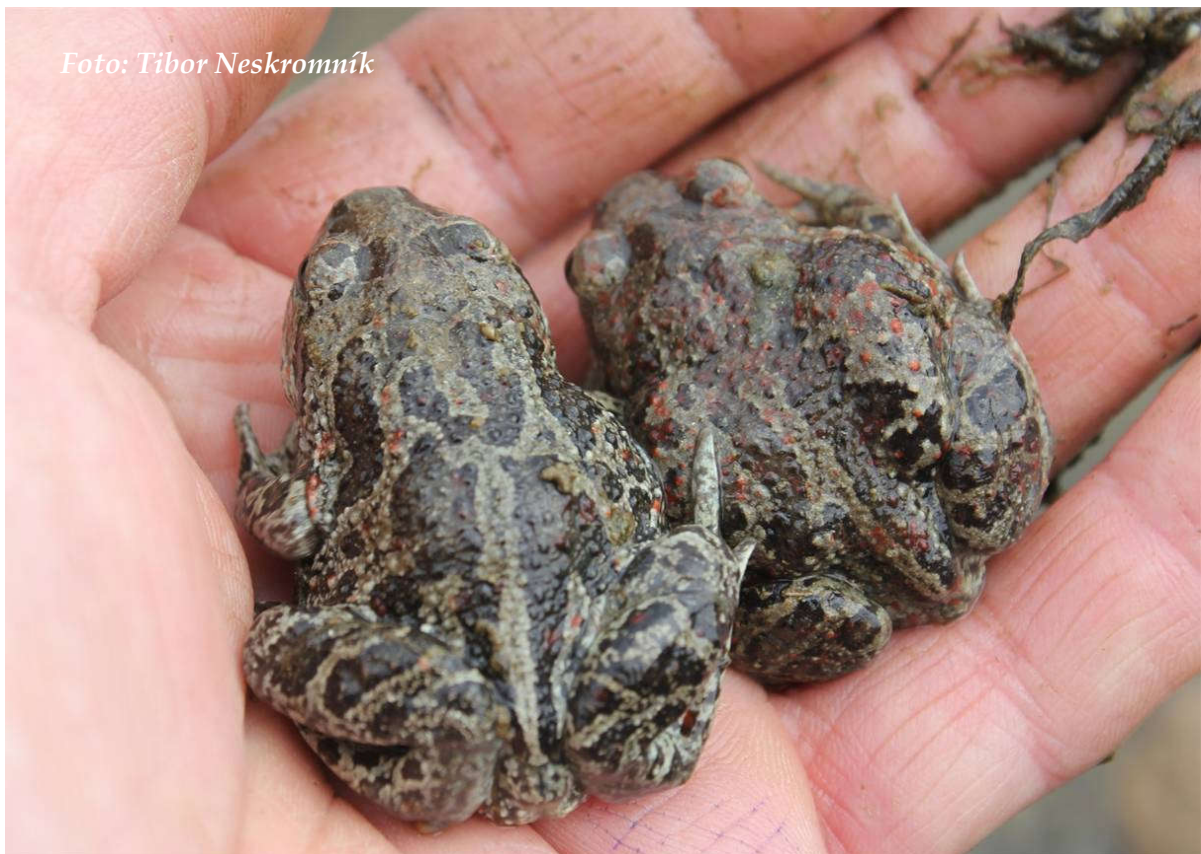
Foto 9: Blatnic se letos u Svitáku chytlo rekordní množství (duben 2015)