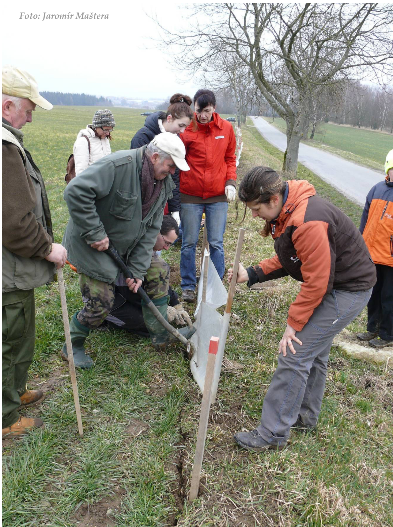
Foto 5: Zasouvání folie do drážky a kompletace zábran (březen 2016)