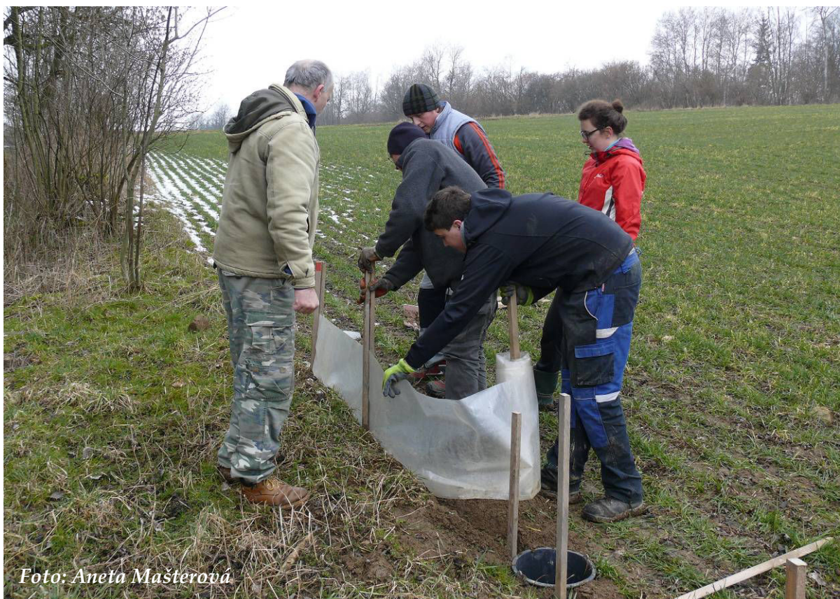
Foto 1: Budování zábran u Svitáku – zatlukání kůlů a upevňování folie (březen 2016)