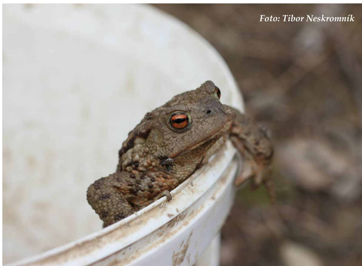
Foto 9: Ropucha obecná je hlavním přenášeným druhem u Svitáku (duben 2016)