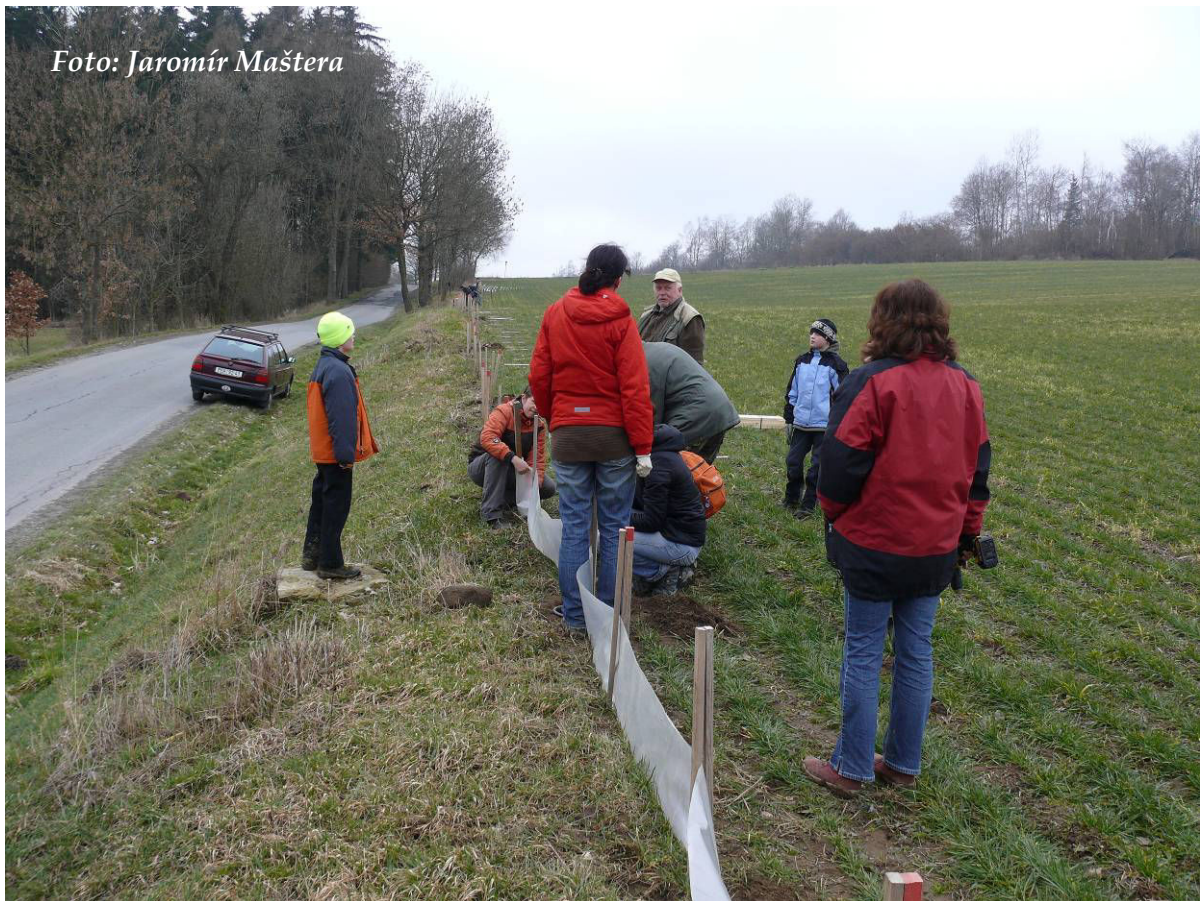
Foto 3: Instalace zábran u Svitáku – první tým v popředí, druhý v pozadí (březen 2016)