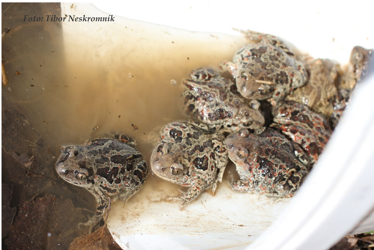
Foto 6: Vypouštění odchytených blatnic k rybníku Sviták (duben 2017)