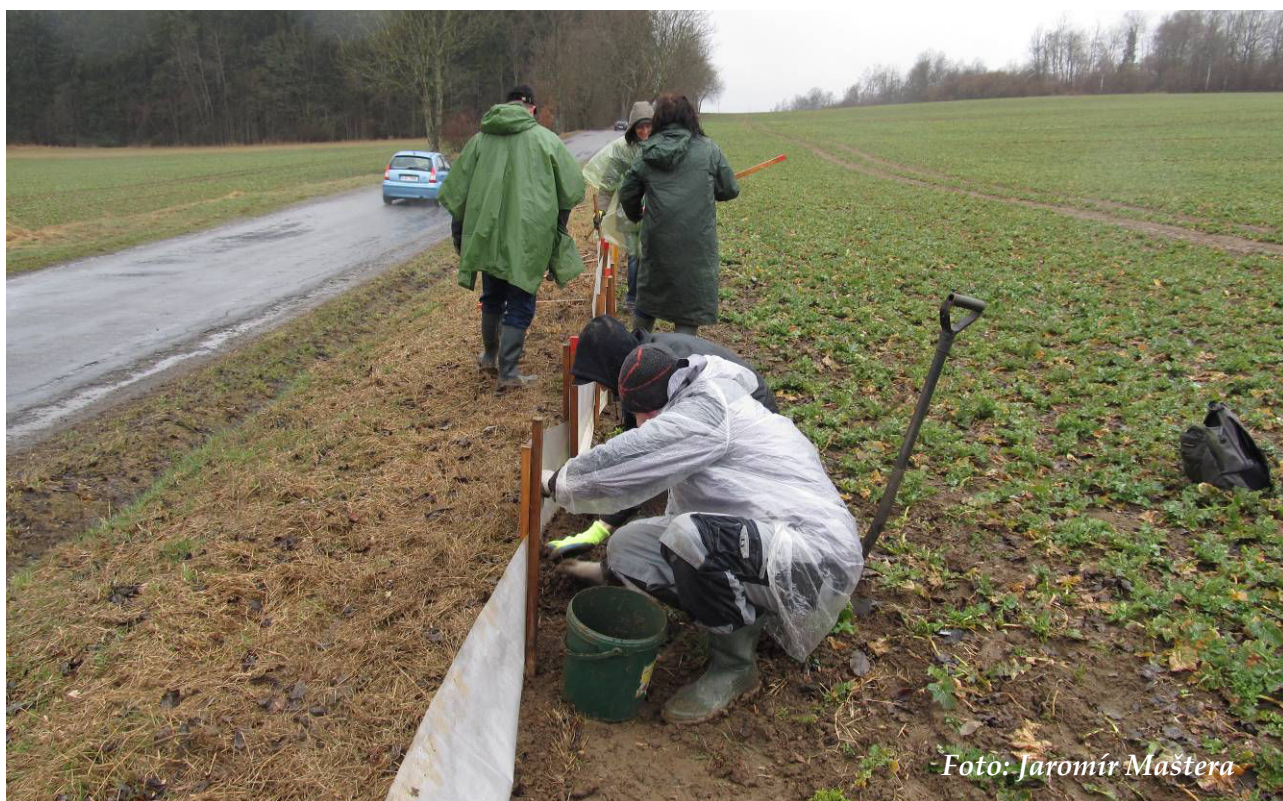
Foto 1: Budování zábran u Svitáku – zatlukání kůlů a upevňování folie (březen 2017)