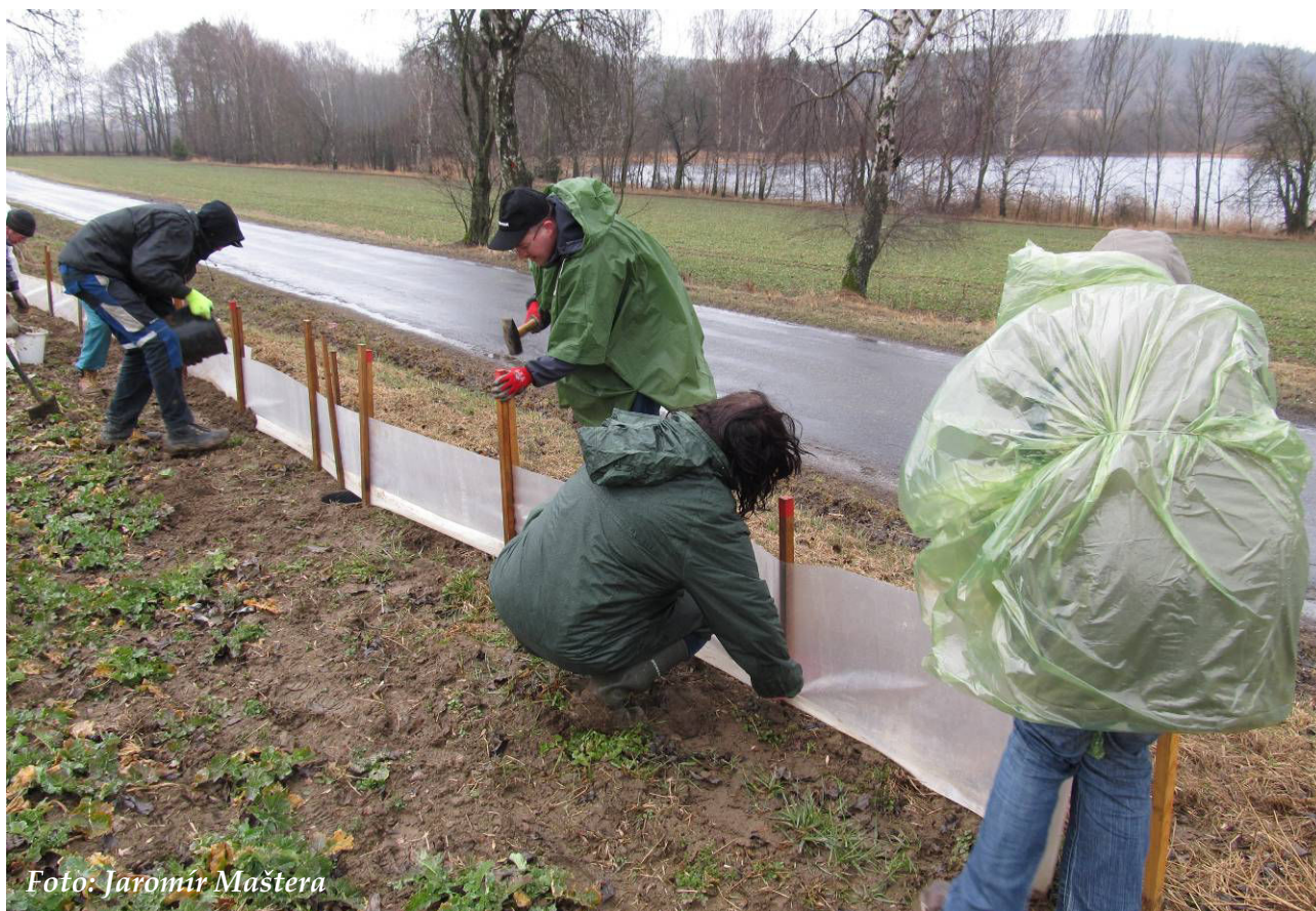
Foto 2: Budování zábran probíhalo v roce 2017 za velmi nepříznivého počasí (březen 2017)