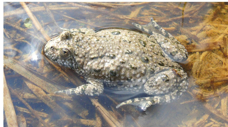
Kuňka ohnivá – nejohroženější druh obojživelníka, který se zde vyskytuje. S důrazem na její podporu jsou některá managementová opatření prováděna.