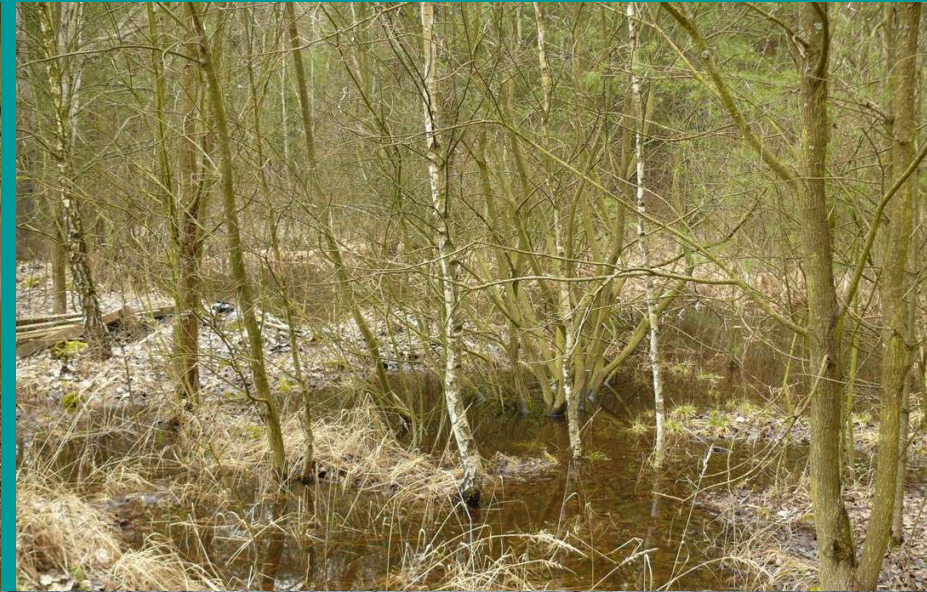
Rosnatková tůň v roce 2009