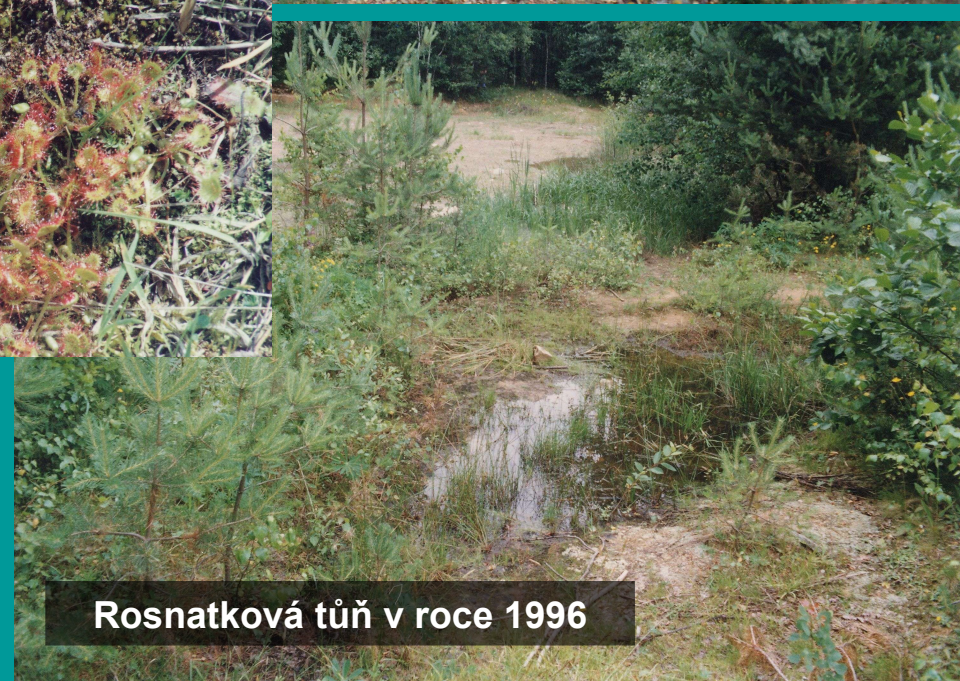
Rosnatková tůň v roce 1996