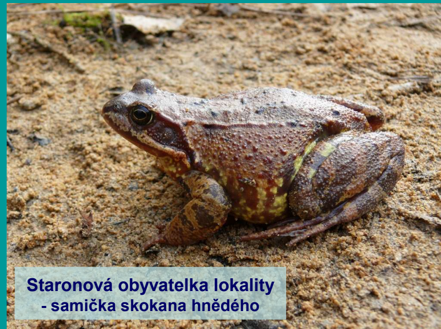
Staronová obyvatelka lokality - samička skokana hnědého