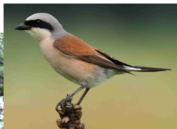
tuhýk obecný ( Lanius collurio )

Lokalita „Pístovské mokřady“ se vyznačuje kromě jiného poměrně velkou bohatostí obojživelníků a plazů. I když se nejedná o veřejnosti příliš oblíbená zvířata, i ony mají právo na svoji existenci. Jejich úbytek v posledních desetiletích je dán zejména těmito faktory: