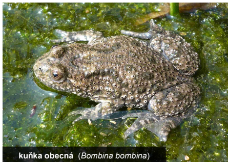
kuňka obecná ( Bombina orientalis )

Nacházíte se na okraji bývalého vojenského prostoru Pístov. Od roku 2008 zde Pobočka České společnosti ornitologické na Vysočině pečuje o několik hektarů pozemků za účelem podpory vzácných a ohrožených druhů rostlin a živočichů, které se zde vyskytují. Mezi nejzajímavější patří obojživelník kuňka obecná, čolek velký, blatnice, rosnička, skokan ostronosý a čolek obecný, plazi ještěrka živorodá, ještěrka obecná a užovka obojková, ptáci bramborníček hnědý, tuhýk obecný, linduška luční, sluka, krutihlav a chřástal polní, motýli modrásek černolemý a osenice západní, brouk střevlík Scheidlerův a šídlo červené. Z rostlin je nejvýznamnější a na loukách nejnápadnější orchidej vemeník dvoulistý, v tůních pak rdest alpský a blatěnka vodní.