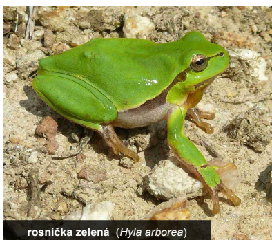
rosnička zelená ( Hyla arborea )