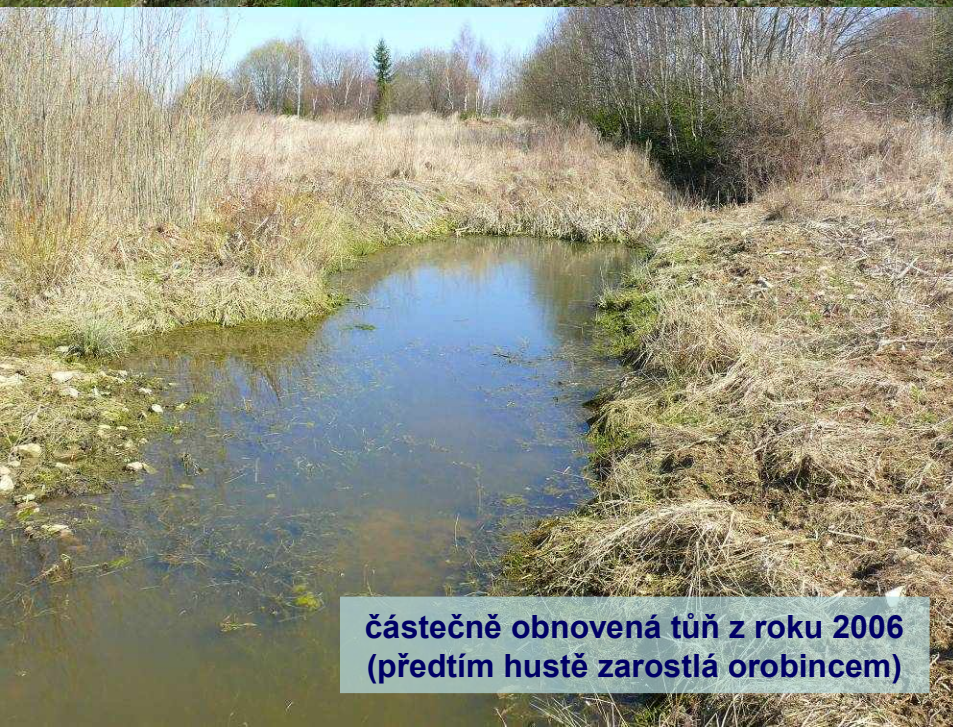
částečně obnovená tůň z roku 2006 (předtím hustě zarostlá orobincem)