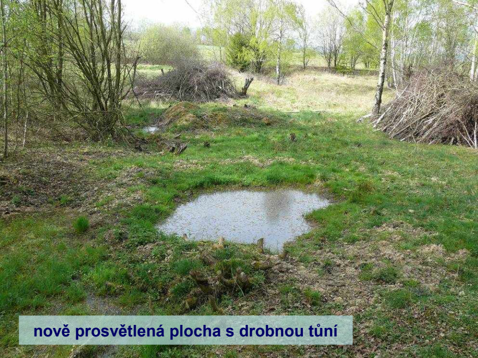
nově prosvětlená plocha s drobnou tůň