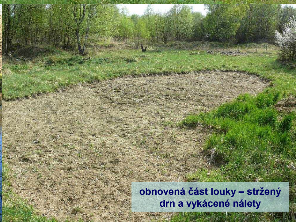
obnovená část louky – stržený drn a vykácené nálety