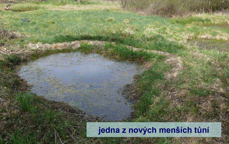
jedna z nových menších tůň