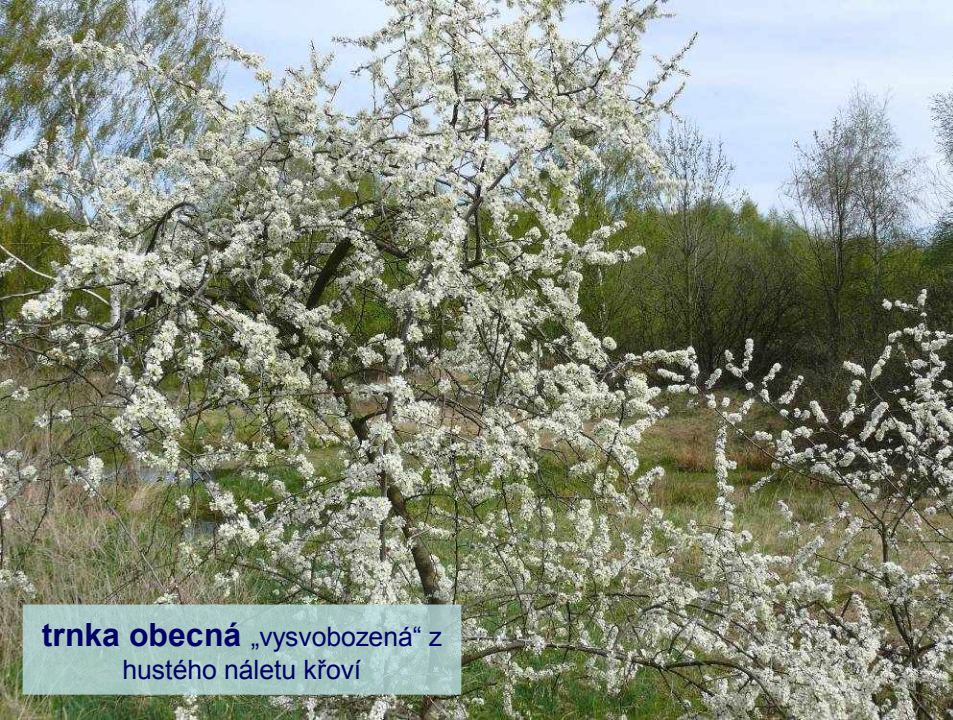
trnka obecná „vysvobozená“ z hustého náletu křoví

Děkujeme městu Jihlava za pronájem pozemků a Ministerstvu životního prostředí (prostřednictvím AOPK a ČSOP) a Sdružení Krajina za finanční podporu na péči o tuto významnou lokalitu.