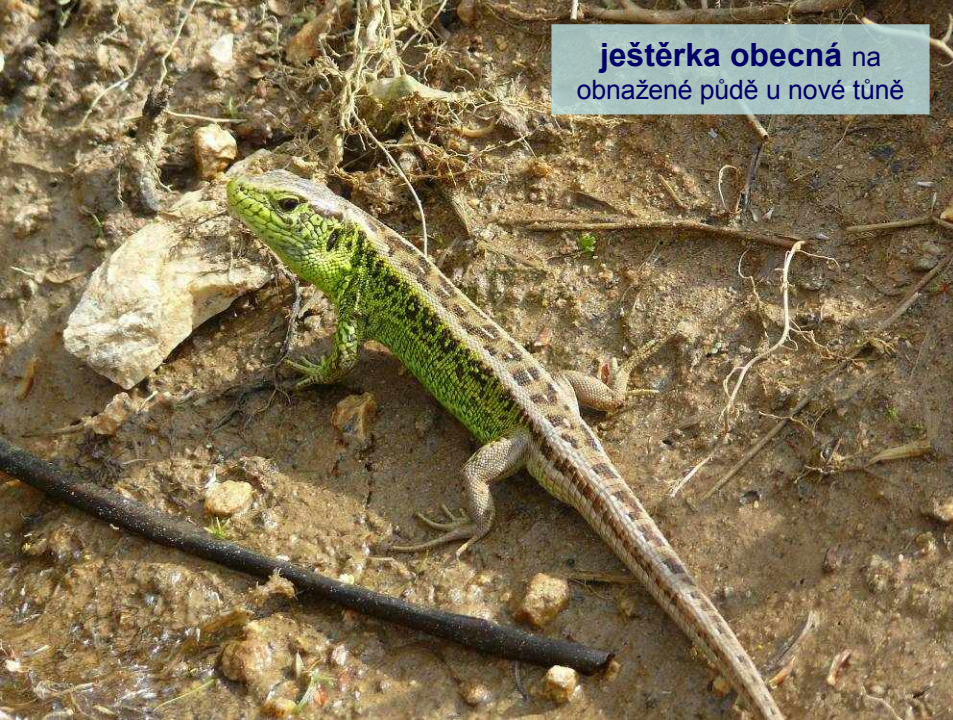
ještěrka obecná na obnažené půdě u nové tůně