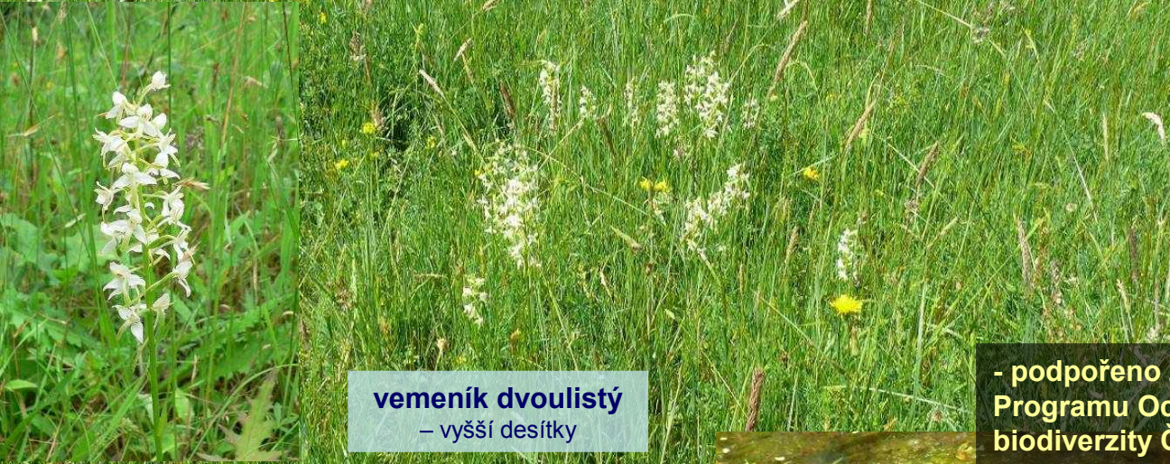
vemeník dvoulistý – vyšší desítky