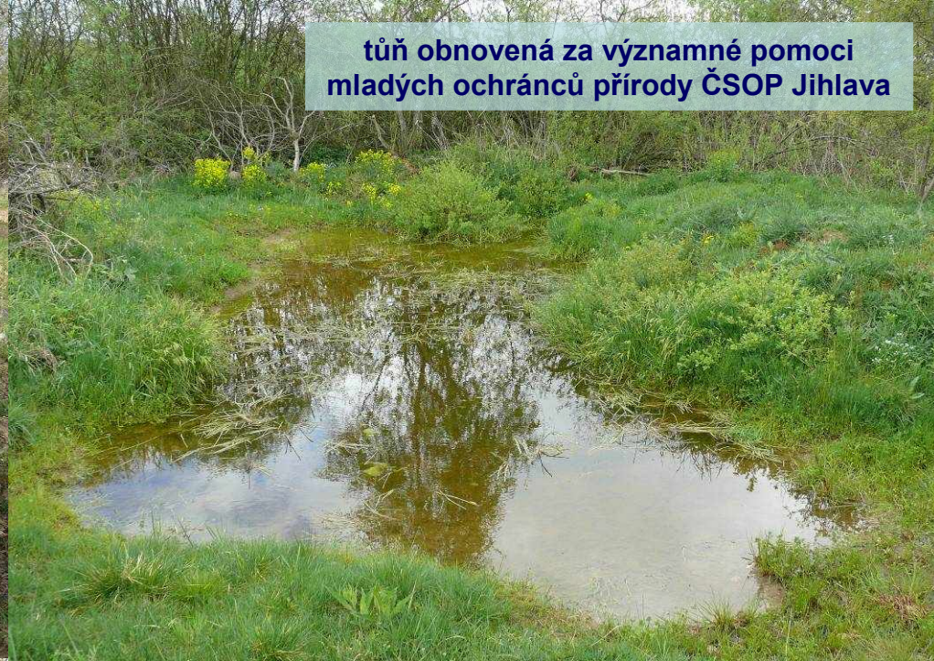
tůň obnovena za významné pomoci mladých ochránců přírody ČSOP Jihlava