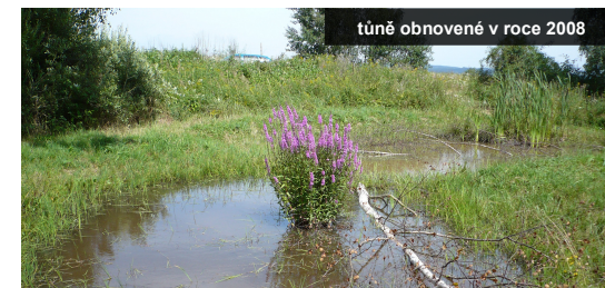
tůně obnovené v roce 2008