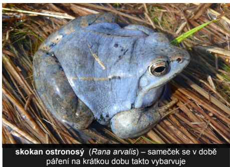
skokan ostronosý ( Rana arvalis ) – sameček se v době páření na krátkou dobu takto vybarvuje

Nacházíte se na okraji bývalého vojenského prostoru Pístov. Od roku 2008 zde Pobočka České společnosti ornitologické na Vysočině pečuje o několik hektarů pozemků za účelem podpory vzácných a ohrožených druhů rostlin a živočichů, které se zde vyskytují. Mezi nejzajímavější patří obojživelníci čolek velký, blatnice, rosnička, skokan ostronosý a čolek obecný, plazi ještěrka živorodá, ještěrka obecná a užovka obojková, ptáci bramborníček hnědý, t'uhýk obecný, linduška luční, sluka, krutihlav a chřástal polní, motýlí modrásek černolemý, otakárek fenyklový a osenice západní, brouk střevlík Scheidlerův a šidlo červené. Z rostlin je nejvýznamnější a na loukách nejnápadnější orchidej vemeník dvoulístý, v tůních pak rdest alpský a blatěnka vodní.