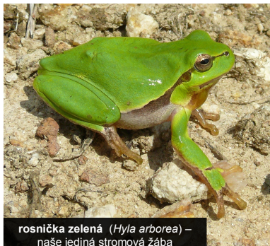
rosnička zelená ( Hyla arborea ) – naše jediná stromová žába

V případě potřeby pravidelných vjezdů či průjezdů územím prosím kontaktujte Pobočku ČSO na Vysočině (kontaktní osoba viz níže). Pro pěši není pohyb po území nijak omezen.