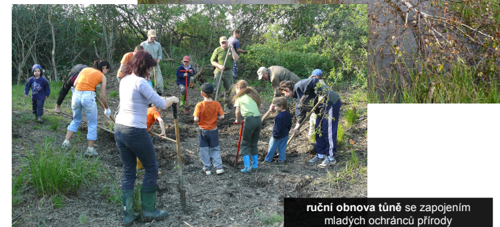
ruční obnova tůně se zapojením mladých ochránců přírody

Od roku 2013 je v části Pístovských mokřadů prováděn speciální management za pomoci pojezdů off-roadových automobilů v období 15.9.–15.3 (mimo období rozmnožování a hnízdění ohrožených živočichů):