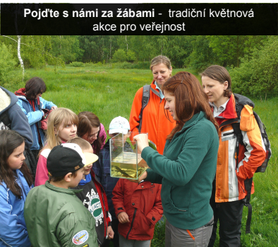
Pojďte s námi za žábami - tradiční květnová akce pro veřejnost