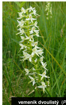
vemeník dvoulístý ( Platanthera bifolia )

Často vžitá představa, že vojenská území jsou značně zdevastovaná a přírodovědně i jinak bezcenná, je mylná. Opak je pravdou a i toto území je toho důkazem. Vhodnou péčí se snažíme zachovat a zvýšit už tak vysokou biologickou hodnotu tohoto území.