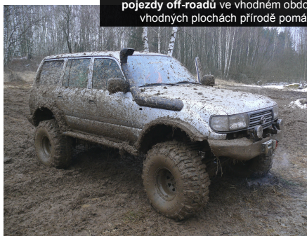
pojezdy off-roadů ve vhodném období a na vhodných plochách přírodě pomáhají