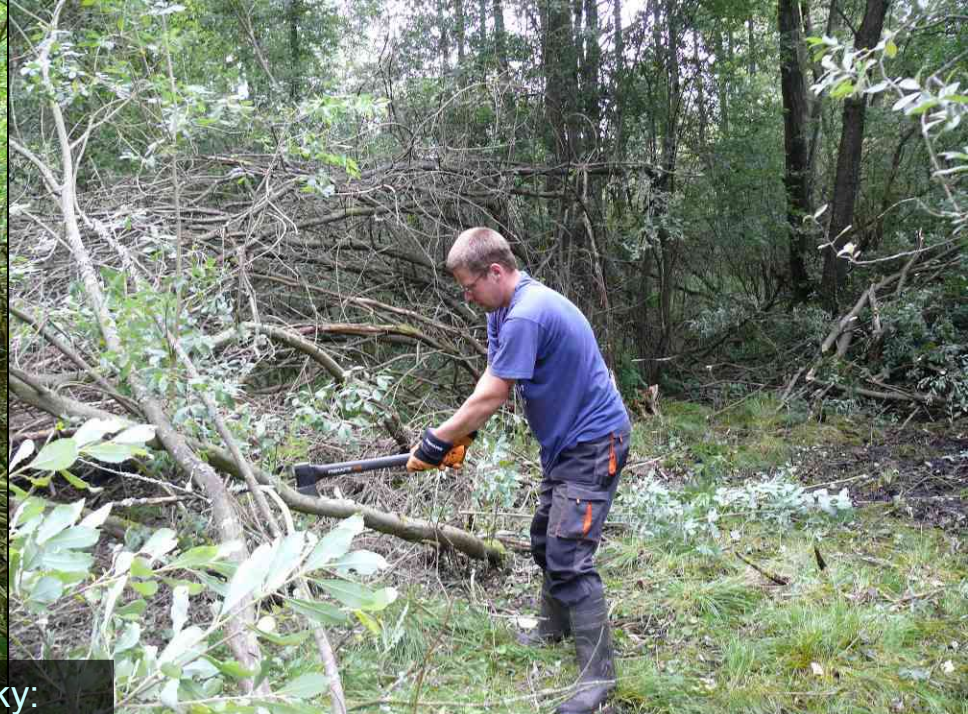
Kácení a prořezávky: na ploše nejméně 1100 m 2