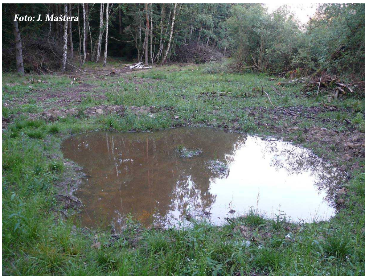
Foto 18: Finální podoba tůně po zaplnění vodou – okolí bylo ještě prokáceno (červenec 2012)