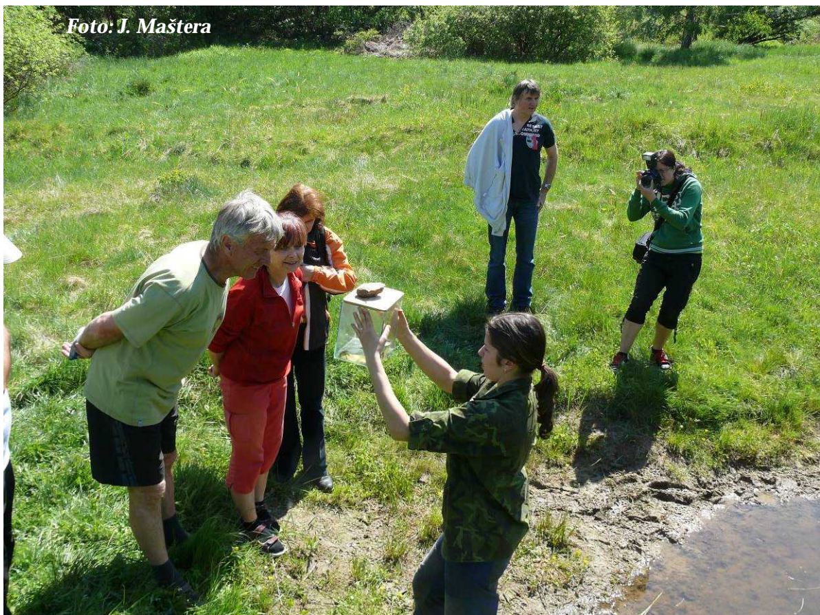
Foto 3: Ukázky obojživelníků na Pistovských mokřadech 19.5. (květen 2012)