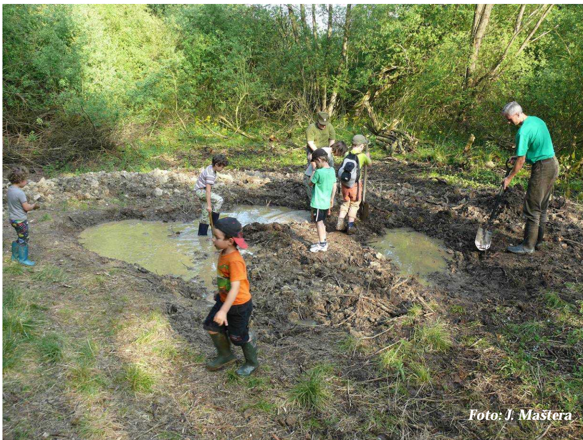
Foto 12: Pokračování tvorby nové tůně nad Okrouhlikem (květen 2012)