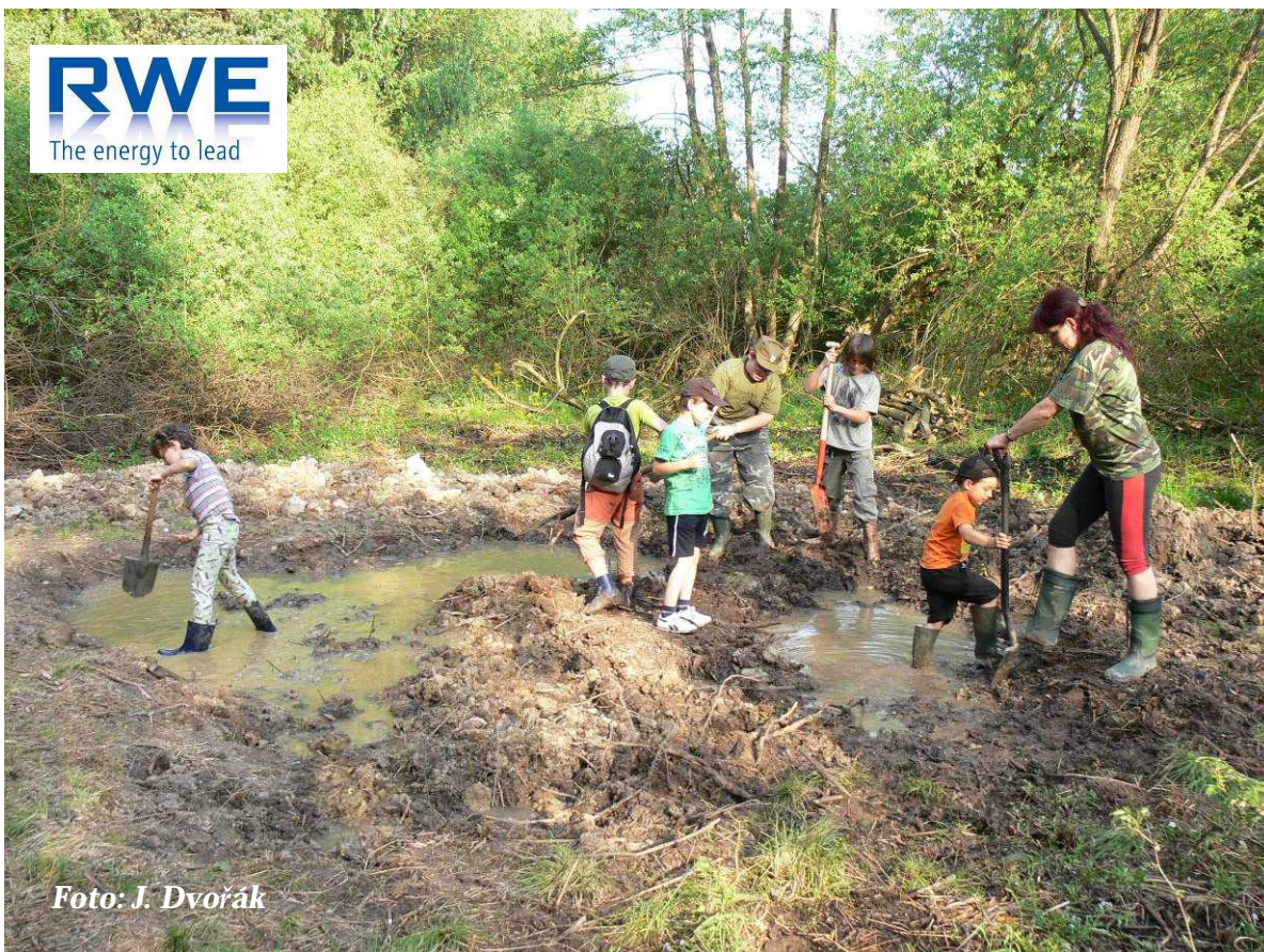
Foto 11: Děti se ihned pustily do pokračování budování tůně (květen 2012)