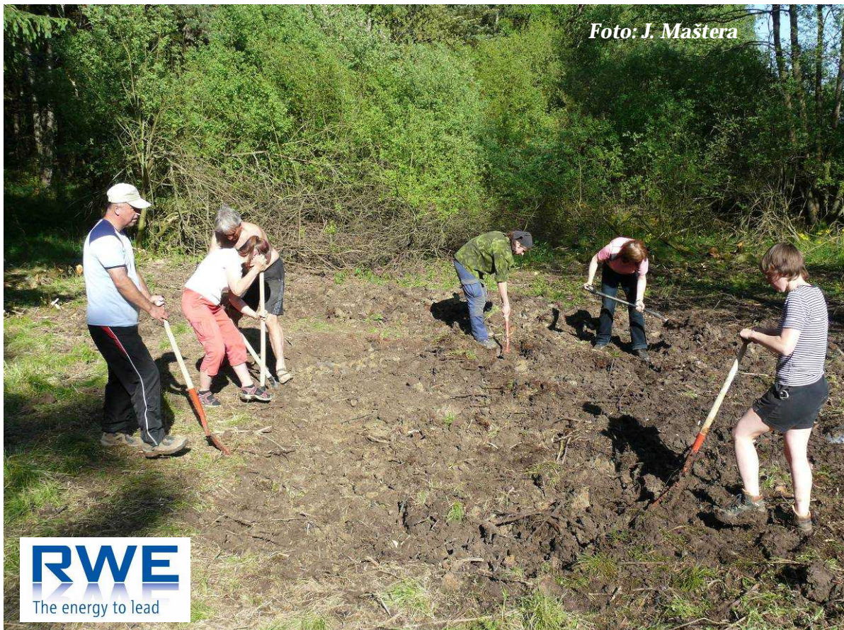
Foto 8: Budování tůně nad Okrouhlíkem je v plném proudu... (květen 2012)