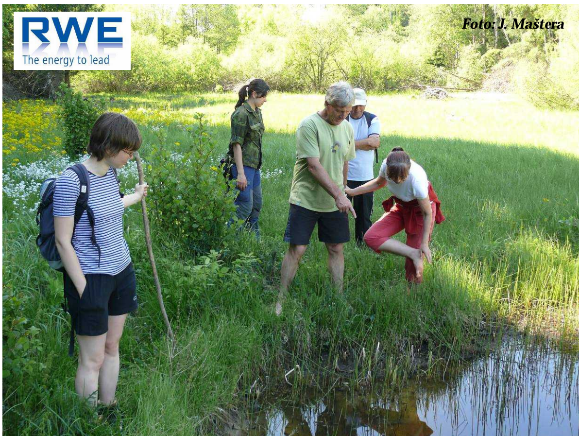
Foto 6: Exkurze nad Rančářovským Okrouhlikem – u tůně (květen 2012)