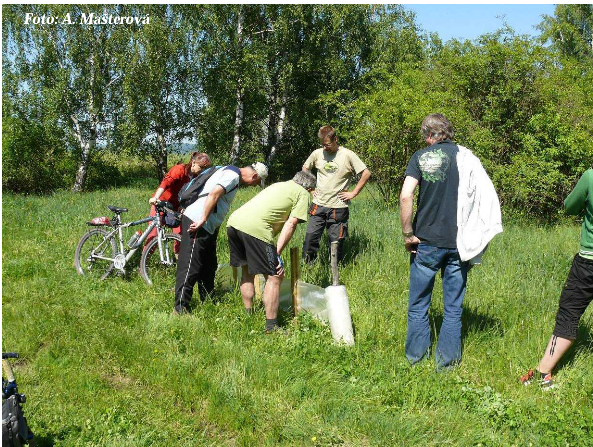
Foto 5: Ukázky dočasných zábrán na ochranu obojživelníků (květen 2012)