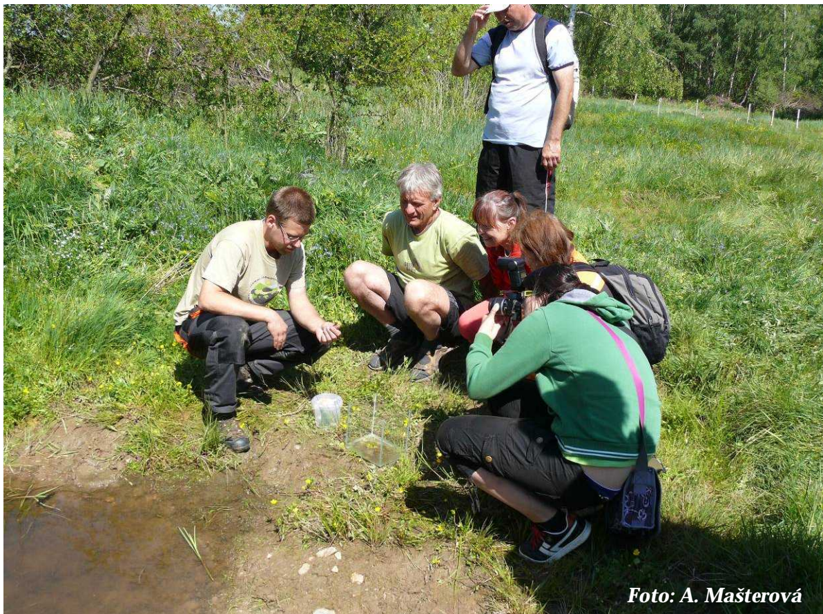
Foto 4: Ukázky obojživelníků na Pistovských mokřadech (květen 2012)