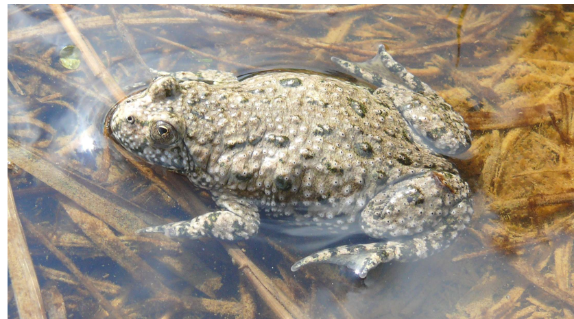
Kuňka ohnivá – nejohroženější druh obojživelníka, který se zde vyskytuje. Zejména na její podporu jsou managementová opatření prováděna.