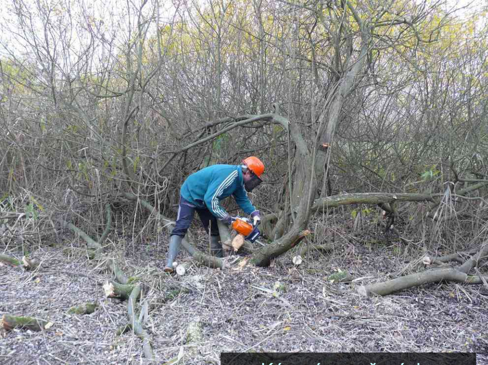
Kácení a prořezávky