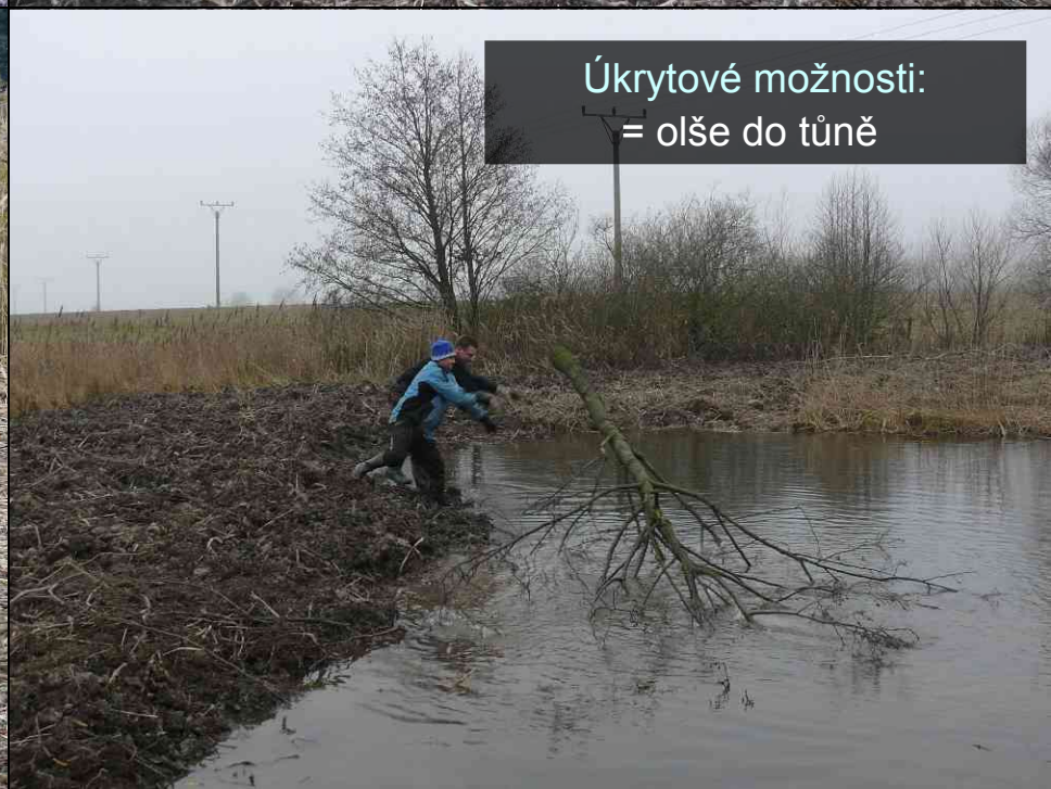
Úkrytové možnosti: = olše do tůň