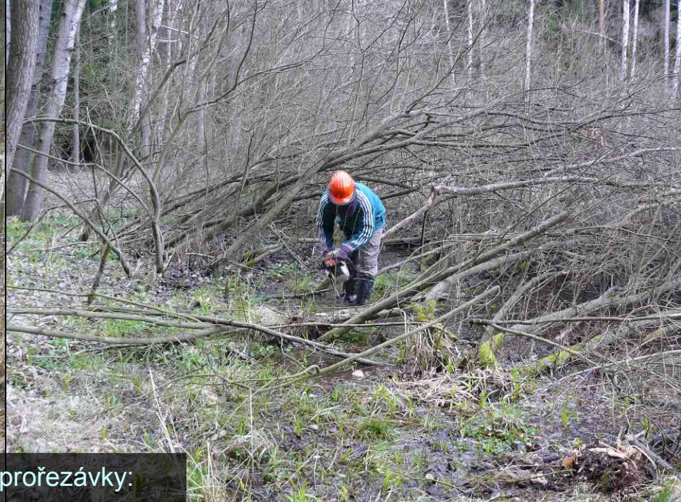
Kácení a prořezávky: břehové porosty – keře plocha nejméně 1100 m 2