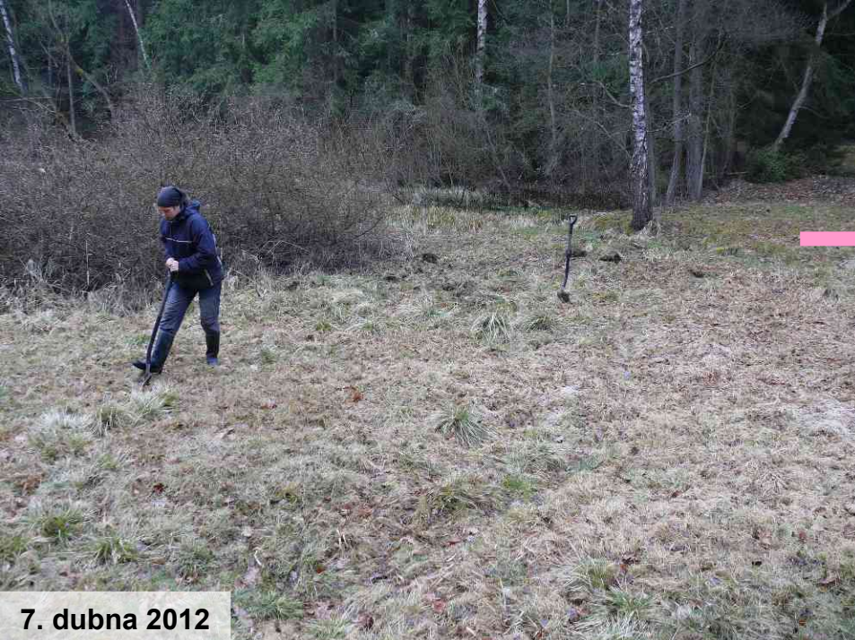
7. dubna 2012