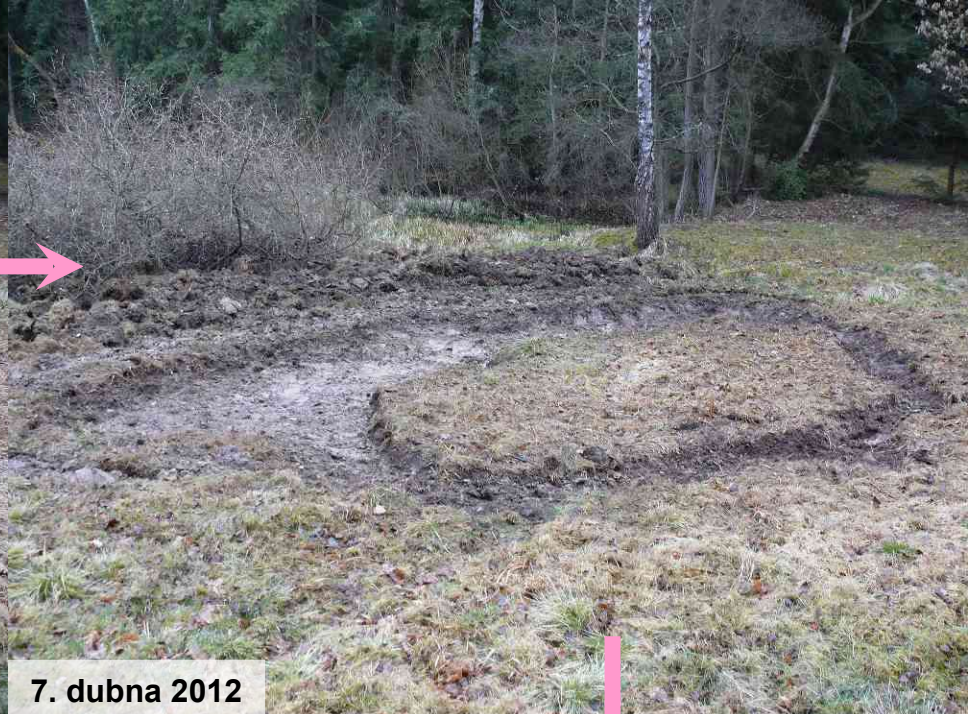
7. dubna 2012