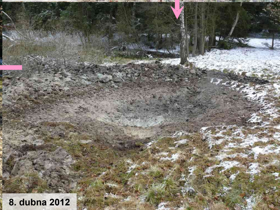
8. dubna 2012