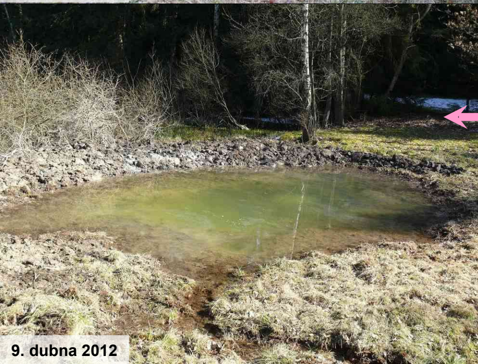
9. dubna 2012