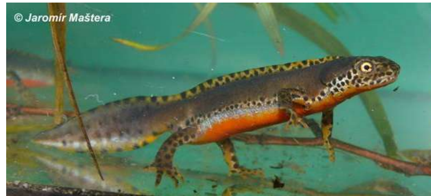
Čolek horský – jeden z vzácných druhů zde se vyskytujících obojživelníků, na jehož podporu je péče o mokřad zaměřena